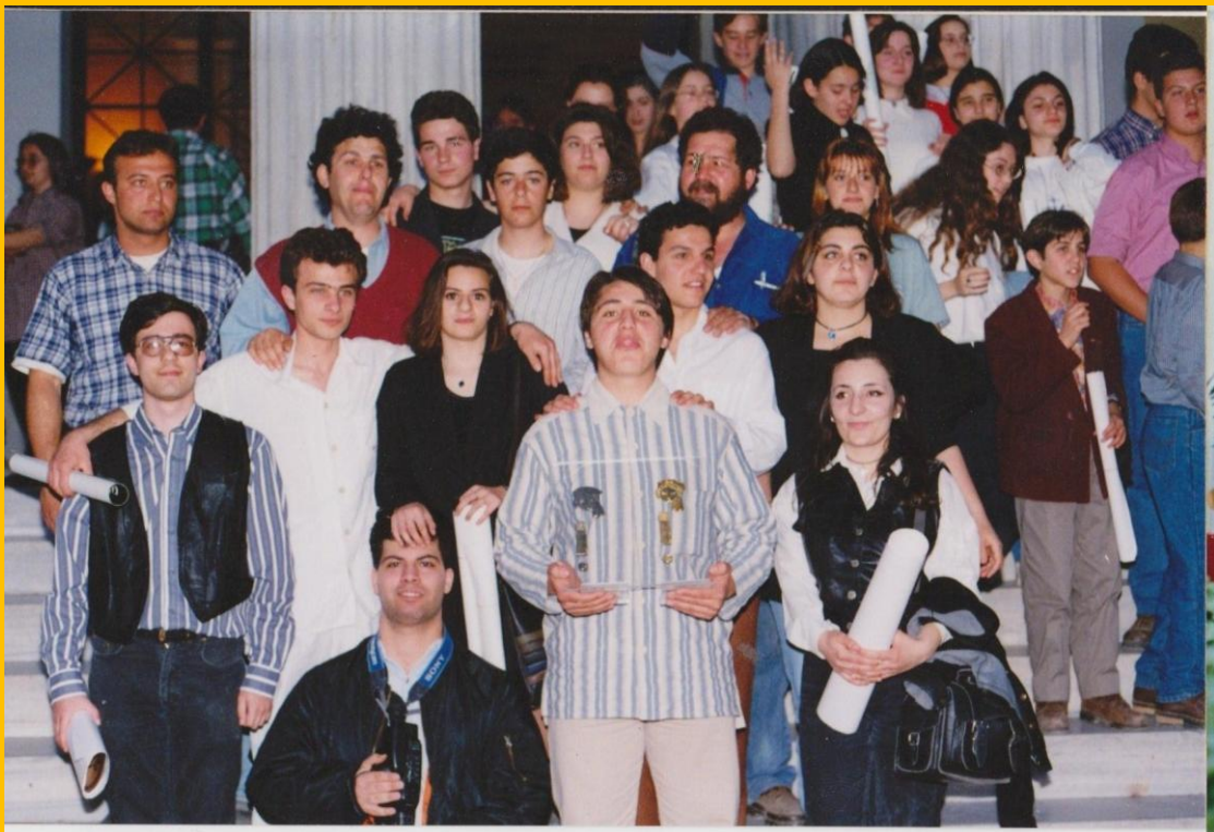
Ζάππειο Μέγαρο. Μετά την απονομή, με το βραβείο στο χέρι .