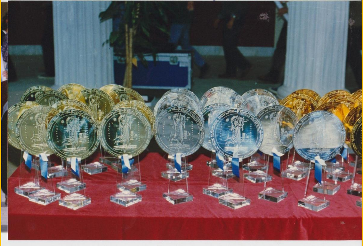
Ζάππειο Μέγαρο, περιμένοντας τα αποτελέσματα.