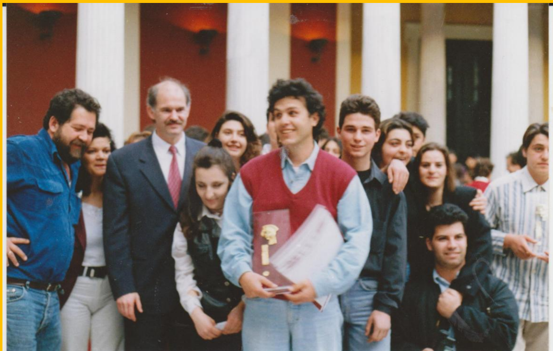
Απονομή του Α Βραβείου Περιφέρειας από τον Υπ. Παιδείας Γιώργο Παπανδρέου, στο Ζάππειο Μέγαρο .