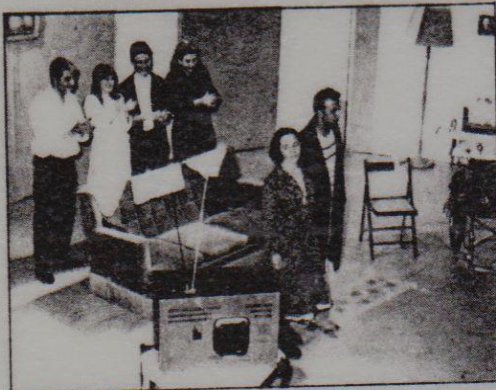
Στιγμιότυπο από την παράσταση «Το Ματς» που έδωσε η θεατρική ομάδα της 1ης ΤΕΣ στο θέατρο «ΒΡΕΤΑΝΙΑ» στις 12 Μαΐου 1996.

α) Τους «Αχαρνής» του Αριστοφάνη που τιμήθηκε με το 3ο Βραβείο Αρχαίου