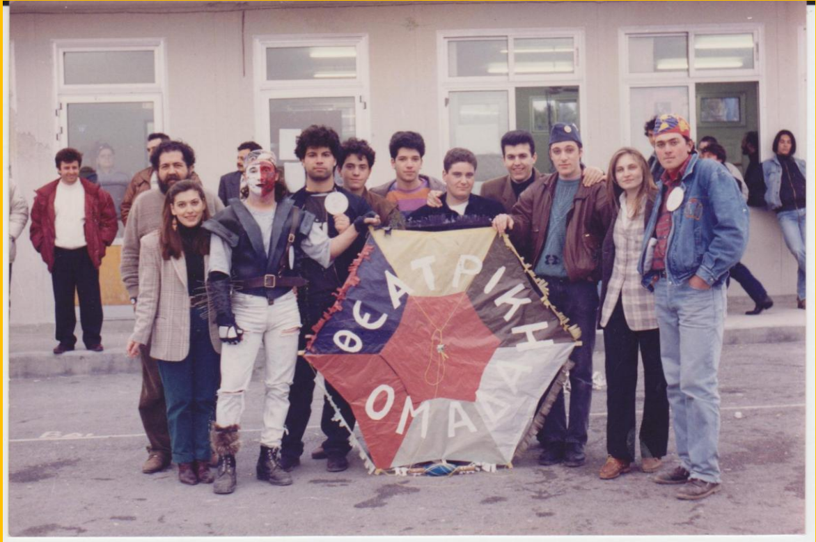
Απόκριες στο σχολείο με τη θεατρική Ομάδα