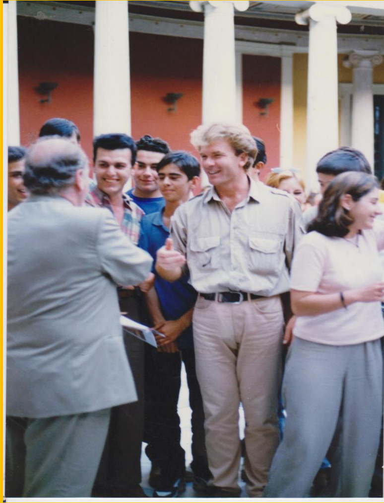
Βράβευση από τον Υπ. Παιδείας Γ. Αρσένη στο Ζάππειο Μέγαρο.